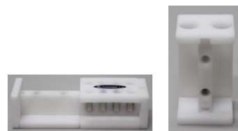
1.5 ml 离心管应用 15 ml 离心管应用